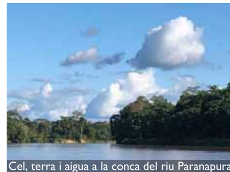
Cel, terra i aigua a la conca del riu Paranapura

A diferència de Lima, a Tarapoto ens rep un dia radiant, barreja de la calor i la humitat que caracteritzen el clima tropical. Uns nois ens ofereixen de seguida un motocarro per traslladar-nos a la parada de taxis San Martín. Més de dues hores de taxi compartit, i 20 soles per cap, ens separen del punt oficial d'inici