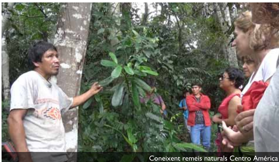
Coneixent remeis naturals Centro Amèrica

Volviendo a ese césped donde estaba sentada en círculo con los adolescentes, decidí seguir mi curiosidad y mi fascinación por ese conocimiento transgeneracional y crear una conversación para intercambiar perspectivas acerca de la medicina. Conocimiento que, antes de visitar Perú, esperaba que solo conservaran ya unos pocos curanderos ancianos. Sin menospreciar el conocimiento médico del cual provengo y admiro también, ver que personas tan jóvenes poseían nociones sobre todo tipo de plantas medicinales, desde el jengibre a la ayahuasca, pasando por cortezas de árboles para tratar todo tipo de dolencias, me hizo rendirme internamente frente a la grandeza de mantenerse enraizado en la naturaleza, tal como aún se puede ver en las culturas indígenas amazónicas. Para mí, una médica europea recién salida de la universidad, se convirtió en un acto de aprecio y admiración el ser testigo de la sabiduría ancestral para enfrentar la enfermedad, no solo física sino también psicoespiritualmente. Intuí una vez más que había entrado en ese espacio mental de eterna duda sobre la dictadura de la ciencia y la medicina alopática, que me hace contactar con una sensación de vergüenza por la soberbia propaganda que conduce a dar por cierta la superioridad de un conocimiento frente a otro.