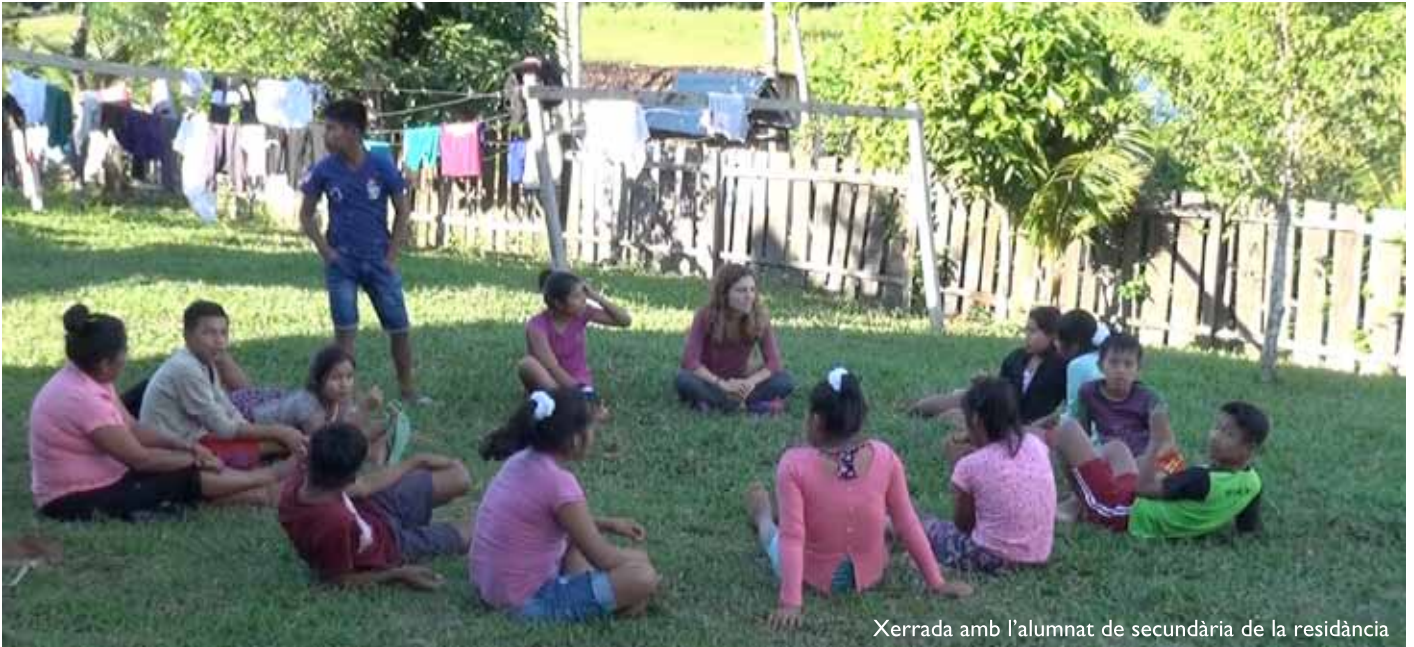
Xerrada amb l'alumnat de secundària de la residència

Olvidándome del temido “isango”, un ácaro que vive en los prados donde pasta el ganado en zonas ribereñas de la selva amazónica, les propuse sentarnos en el césped formando un círculo. Quería acercarme a ellos de alguna forma y hacer desaparecer esa distancia de miles de kilómetros de cultura que nos separaba. Tuve la sensación de que gran parte de ese grupo de adolescentes tenía poco interés en escucharme, incluso a algunos les costaba establecer contacto visual conmigo.