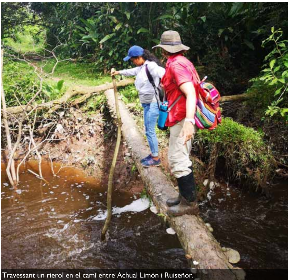
Travessant un rierol en el camí entre Actual Limón i Ruiseñor.