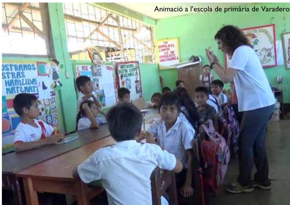
Animació a l'escola de primària de Varadero

A les comunitats de l'Amazònia l'aigua, sigui recollida directa-