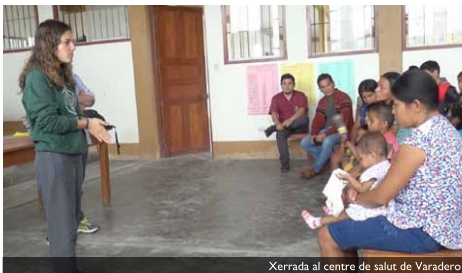
Xerrada al centre de salut de Varadero

en relación con la construcción de la minera, aprecié una cierta pasividad de la población frente a la ocupación del terreno por parte de las empresas y la explotación de los trabajadores. Esta actitud que nosotros concebimos como pasiva quizás no sea más que una mayor capacidad por su parte respecto a los europeos de “estar en paz” con el presente. Quizás sea nuestro ojo el que confunde la aceptación del misterio de la vida con el conformismo. No obstante, admito que no he convivido con ellos lo suficiente como para resolver esta pregunta y también que yo tiendo, o tendía ya, a idealizar internamente la selva. Si bien es cierto que en las comunidades del Paranapura queda poco de ese paraíso perdido del cielo en la Tierra que algunos escritores defienden que había existido en culturas precolombinas, sí que se podría encontrar un atisbo de