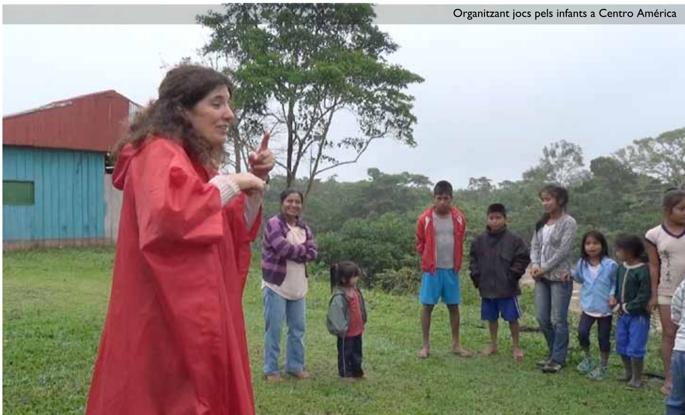
Organitzant jocs pels infants a Centro Amèrica

Per aquest motiu, les actuacions locals i les actuacions globals en aquest àmbit han de ser complementàries i coherents amb un model ecològic i humà que posi en el centre la cura de la naturalesa i de les persones i s'enfronti a la tirania del capital i del consum que ens ha portat fins aquí.