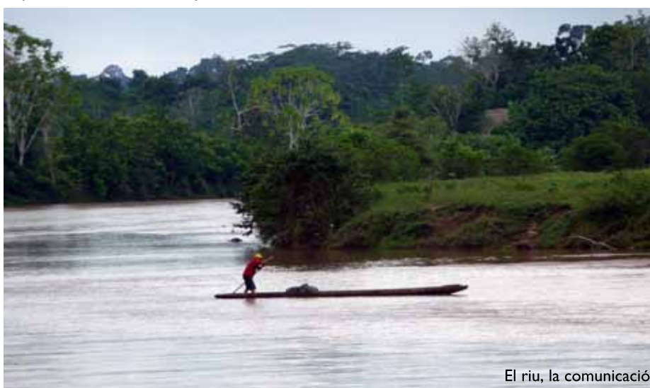
El riu, la comunicació

L'Amazònia no s'entendria sense els seus rius. De sempre ens