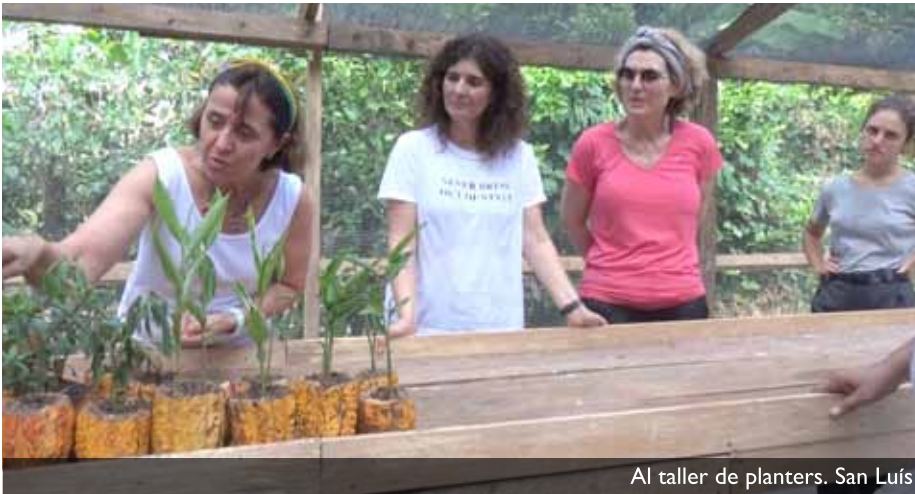
Al taller de planters. San Luís

i amb un gran somriure a la cara, va apartar el separador blau i vàrem veure que el nostre equipatge estava on ells dormien. Ens varen cedir la seva habitació. Només els van caldre deu minuts de conversa, perquè la seva por imaginària s'esfumés. Les gringas no eren la gent que els seus avantpassats els havien explicat que venien a menjar-se els seus fills, segons ens van confessar en un moment d'intimitat. Potser la seva por era més ancestral que la meua. Ells tenien la por imaginària i la real.