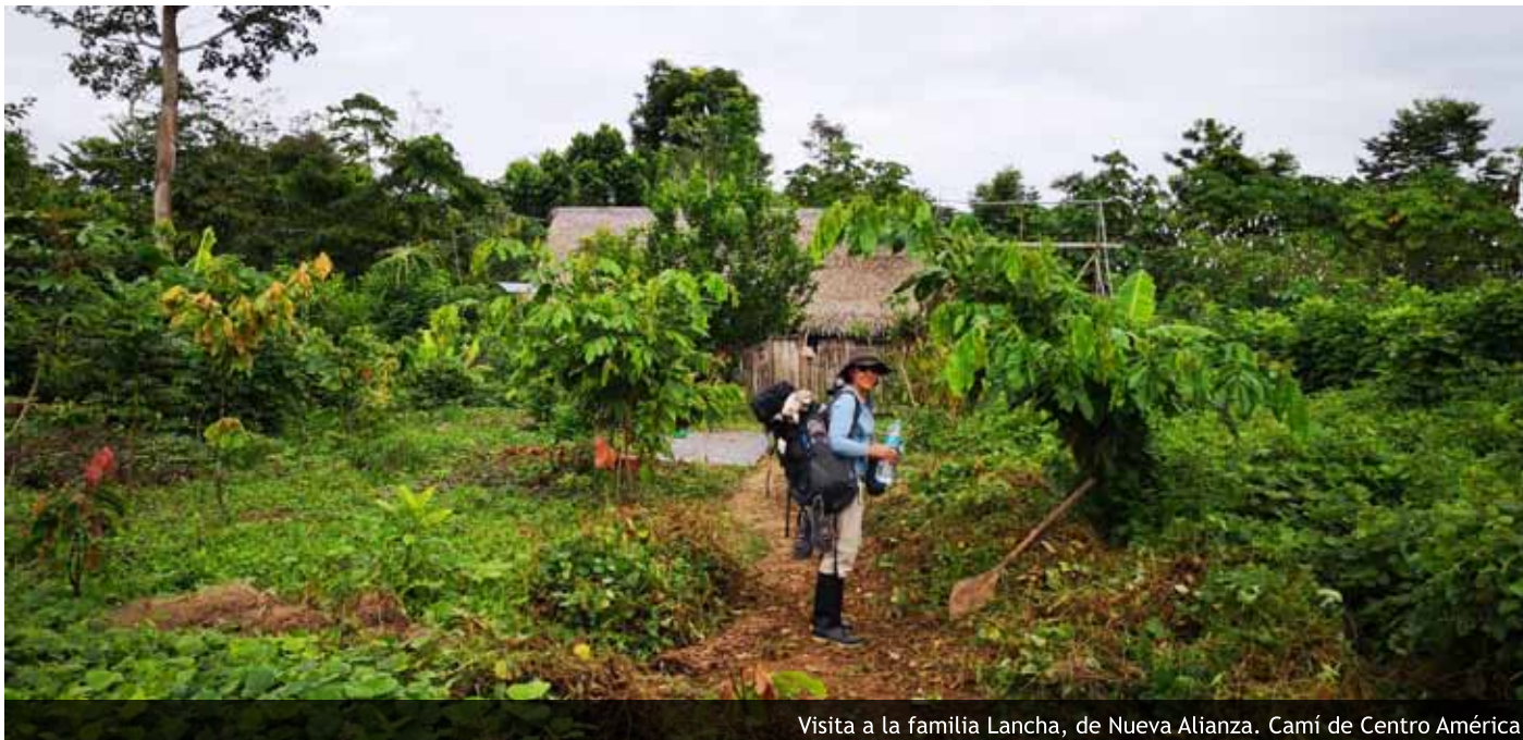
Visita a la família Lancha, de Nueva Alianza. Camí de Centro América

Ja fa unes setmanes que he tornat d'unes estades solidàries al Perú. Del juliol ençà, he tingut temps de pair les experiències físiques i emocionals que durant quinze dies em van acompanyar durant la visita a diverses comunitats que taquen la riba del riu Paranapura, a la selva amazònica. En el meu cas, molt especialment les d'Achual Limón i Ruiseñor, però també les de San Luís, Nueva Alianza, i Centro América. En totes elles he trobat persones que han fet que aquests llocs passin a formar part del meu currículum vital.