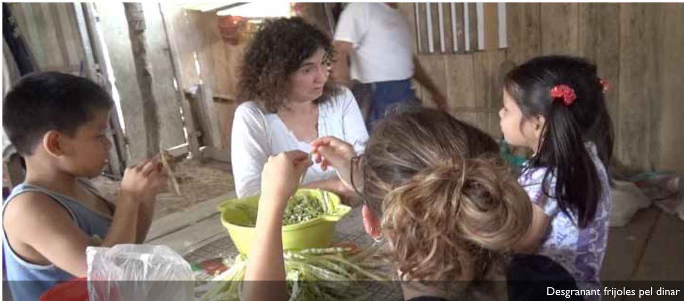
Desgranant frijoles pel dinar