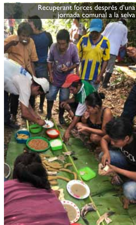
Recuperant forces després d'una jornada comunal a la selva

Una altra de les grans lliçons que m'emporto de l'Amazònia peruana és el sentit de comunitat. Són conscients que per sobreviure han