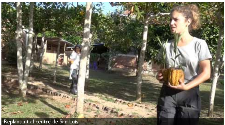
Replantant al centre de San Luís